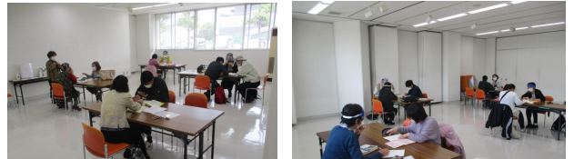
2021年は少人数での教室です。

2020年に拡散が始まった新型コロナウイルスにより活動を停止してきたさむかわ国際交流協会の事業は2021年4月から日本語教室を少人数に限定して再開してきました。