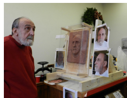
グレップ先生の一言 ” I know him. ”