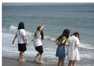
2日目 鎌倉の海を楽しむ