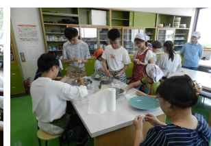
日中みんなで餃子作り