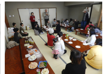
クリスマス会の料理