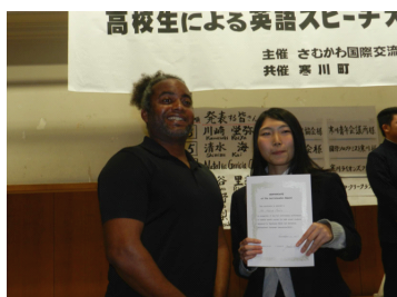
参加者と審査員の交流