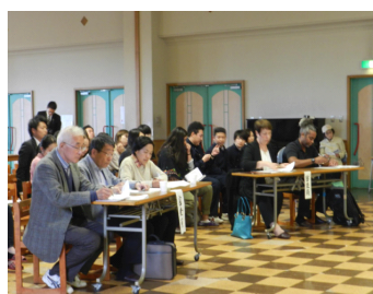
審査は短時間で進行