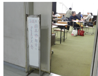
会場入り口と学習風景

2017年秋季日本語教室は12月19日(火)が初級・中級コースの最終回の講座でした。11時で講座を終えてクリスマス会を実施しました。例年と同じように一品持ち寄りの「ポットラックパーティー」です。教室で学んでいる学習者のお国自慢の料理と講師陣の日本料理が並び、おいしいご馳走を楽しみました。なお、上級コースは12月22日が最終です。来春の日本語教室は3月6日(火)から初級・中級コースが、上級コースは3月9日(金)から始まります。学習者の皆さん、3月にまた会いましょう。