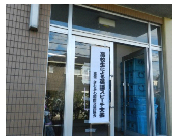
今回の会場は南小学校ふれあいホール