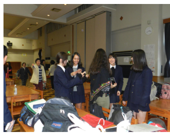
スピーチがすんで歓談の一時