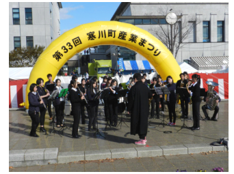
ブラスバンド華やかに

さむかわ産業まつりが11月19日(日)にさむかわ中央公園にてさわやかな青空の下で開催されました。さむかわ国際交流協会は、SIEA 特製「はみだしホットドッグ」とフリーマーケットで国際ソロプチミスト寒川の皆さんのご協力をいただいた物品の販売をしました。「はみだしホットドッグ」とフリーマーケットで多くの方に購入していただきました。おかげさまで今年もユニセフに寄付できました。お買い上げくださった皆様、一緒に準備から撤収まで作業してくださった皆様、ご支援くださった国際ソロプチミスト寒川の皆様、ありがとうございました。