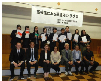
参加者、司会者、審査員そして寒川高校の先生