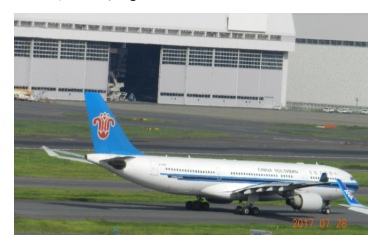
中国への帰国の離陸