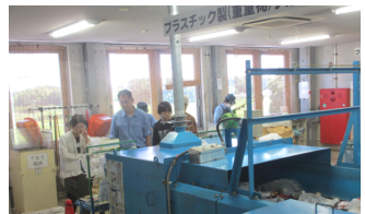
ゴミ資源化の現場を見学

3日目 町内巡り1; 町役場で行政の現場を見学し、広域リサイクルセンターでゴミの資源化を勉強しました。行政の現場とゴミ資源化の現場訪問は、毎回中国の学生に強い印象を残す体験です。途中無人販売所に驚いていました。午後には後藤歯科医院を訪問し、医療現場を見て口腔医を目指すゲストにとって今後の勉強に励みになったことでしょう。