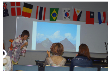
ゲストの故郷・貴州省の紹介