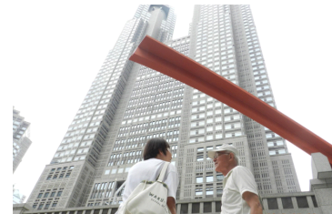
東京都庁舎を背に